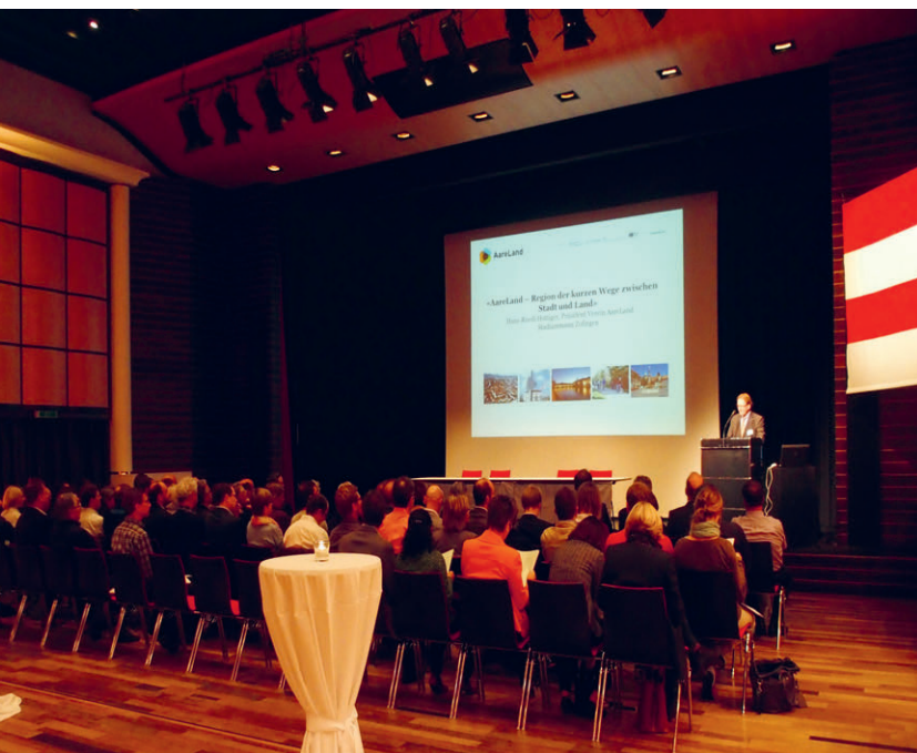
Parlamente-Treffen vom 26. Oktober 2015, Stadtsaal Zofingen