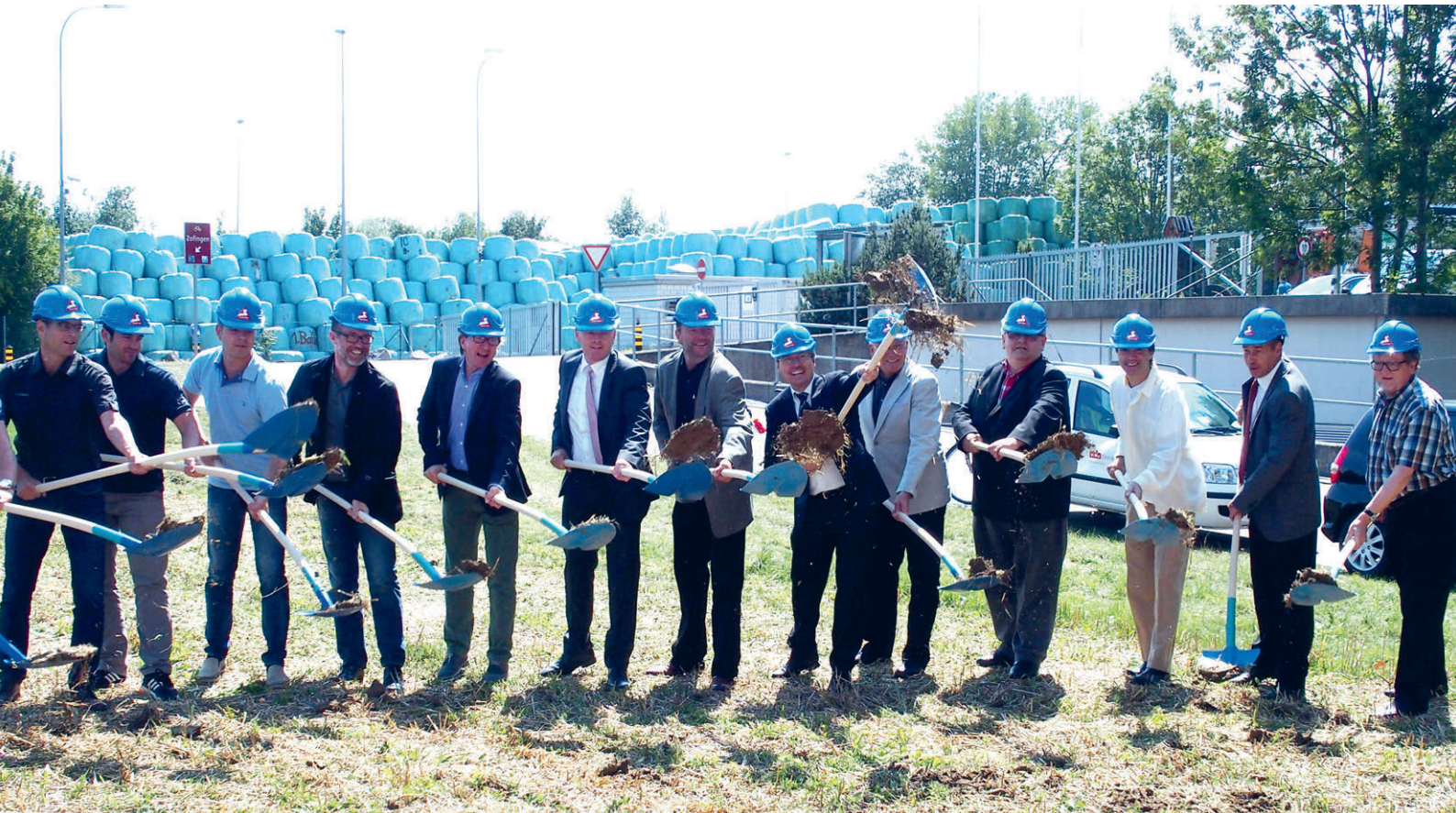
17. August 2015: Spatenstich Wiggertalstrasse. 9 Millionen Franken beträgt der Bundesbeitrag aus dem Agglomerationsprogramm AareLand