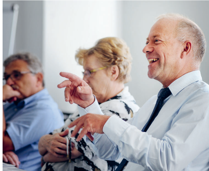
Sitzung AareLandRat im Kustoreisaal in Zofingen