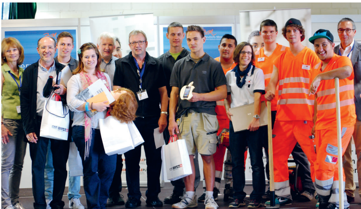
Sieger «bester Stand» BIM AareLand 2015

kürzt. Er betrug 2015 neu 20'000 Franken. Dies, weil das definierte Ziel, die Angebote, welche vor allem in Olten gut eingeführt sind, in allen drei Städten (Aarau, Olten, Zofingen) identisch zu realisieren, nicht wie geplant, erreicht werden konnte. Das Projekt «LearningArea», 2010 gemeinsam mit der Fachhochschule Nordwestschweiz FHNW ins Leben gerufen, bietet mit seinen Angeboten sowohl etablierten Unternehmen als auch Start ups im Wirtschaftsraum AareLand attraktive Angebote. Besonders beliebt sind die sogenannten «Breakfastmeetings». Netzwerkanlässe mit Referenten zu aktuellen Wirtschaftsthemen.