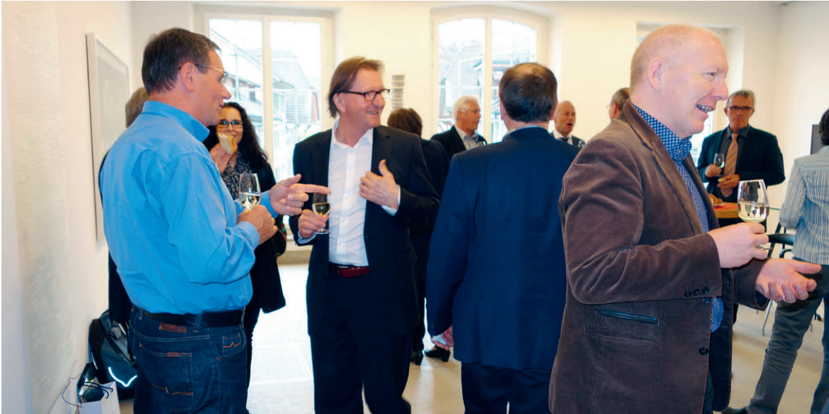
Mitgliederversammlung 30. April 2015 / Apéro im Rathaus Aarau