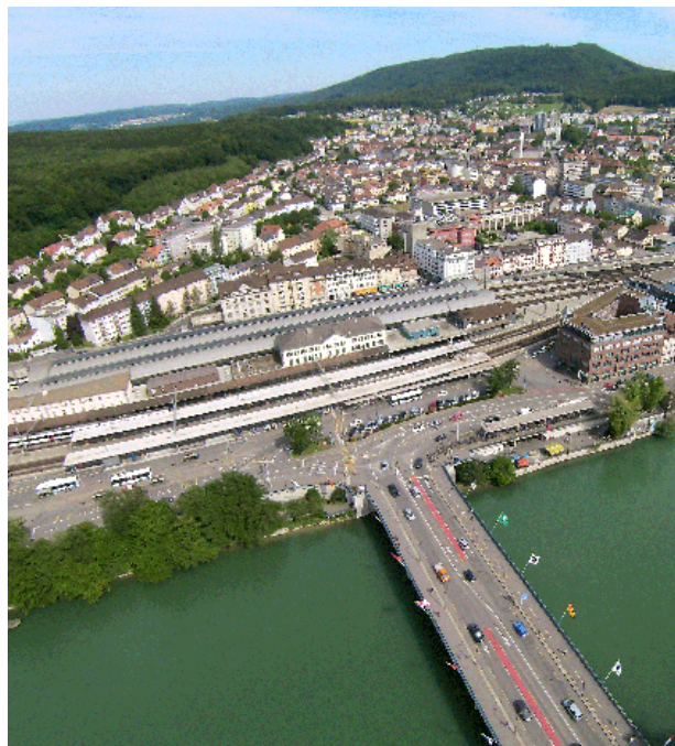
Luftbild des Oltner Bahnhofplatzes

Weitere Details und Infos sind unter https://www.olten.ch/neuerbahnhofplatz abrufbar.