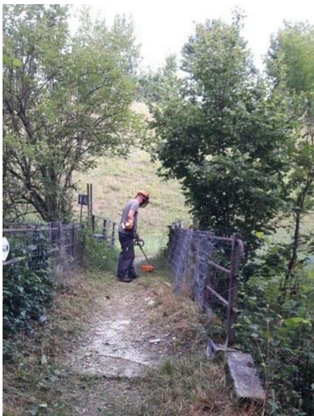
Instandsetzung AareLandWeg im Sommer 2019

Die Geschäftsstelle Aareland lädt die an den AareLandWeg angrenzenden Gemeinden ein, Mängel am Weg fortlaufend zu melden. Eine Wiederholung des Instandsetzungsprojekts im nächsten Sommer ist möglich.